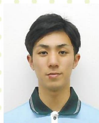
藤院 蓮行 3階療養棟