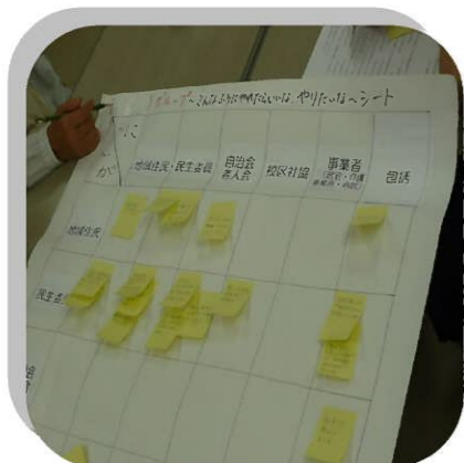
色々な意見が出ました。