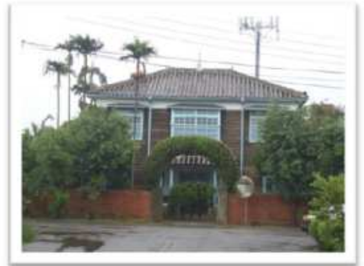
『冬の夏休み』ロケ地

総統府の日本語ガイドのお爺さんに気に入ってもらったのをきっかけにインタビューを申し込むと、快く応じてくれた。戦時中に志願して帝国陸軍に入ったがチャンコロと差別され、戦後大陸から台湾に入ってきた蒋介石軍にはお兄さんが虐殺され、ご本人も処刑執行直前で九死に一生を得たきわどい生還だった。笑顔の裏に、厳しい歴史をご家族とも共有できずに長年生きて来られた日本語世代のお一人だった。