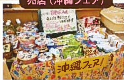
首里城再建の為に売上げを寄付しました。