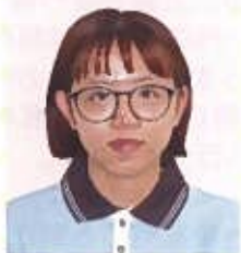
チャンティニュー 3階療養棟